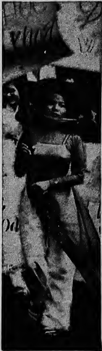
PROTESTA ELEGANTE - E mucha muher vietnemesa aki tabata entre hopi mas mes bunita cune qu a protesta na Saigon pa defende un profesor, quende tabata ser acusa di ta pro-Diem.